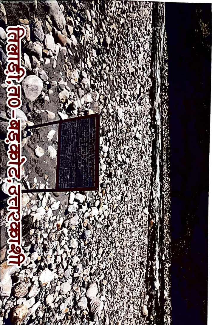
तिहाड़ी, त0-बडकोट, उत्तरकाशी