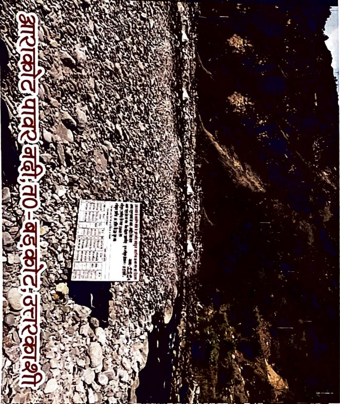
आरकोट पावर बडी, त0-बडकोट, उत्तरकाशी