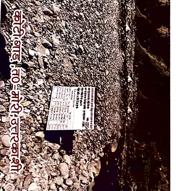
कोटी बाड, त0-मोरी, उत्तरकाशी