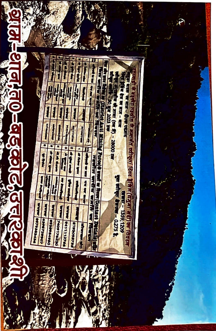
ग्राम-शान, त0-बडकोट, उत्तरकाशी